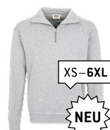
024 ash meliert